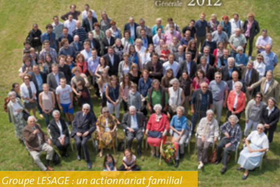
Groupe LESAGE : un actionariat familial