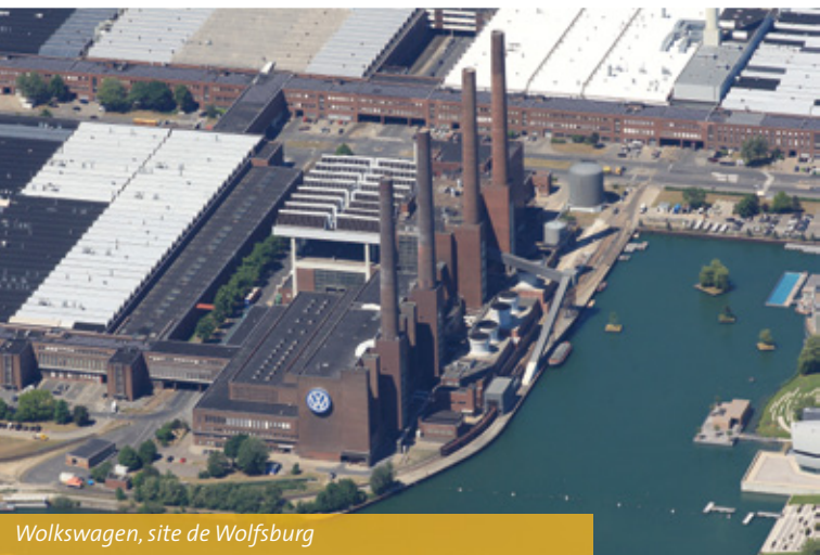
Volkswagen, site de Wolfsburg